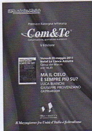
La locandina dell'evento