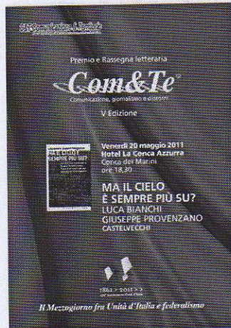
La locandina dell'evento